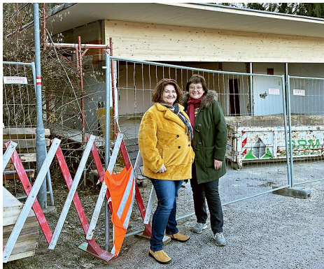
Umbau der Aufbahnhalle zu einem großen Zeremonienraum

Flächenwidmungsplan auf der Gemeinewebsite