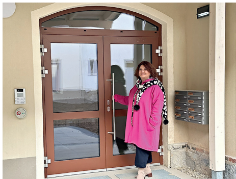
Ein Blickfang in unserer Ortseinfahrt: das fertiggestellte „Betreute Wohnen“